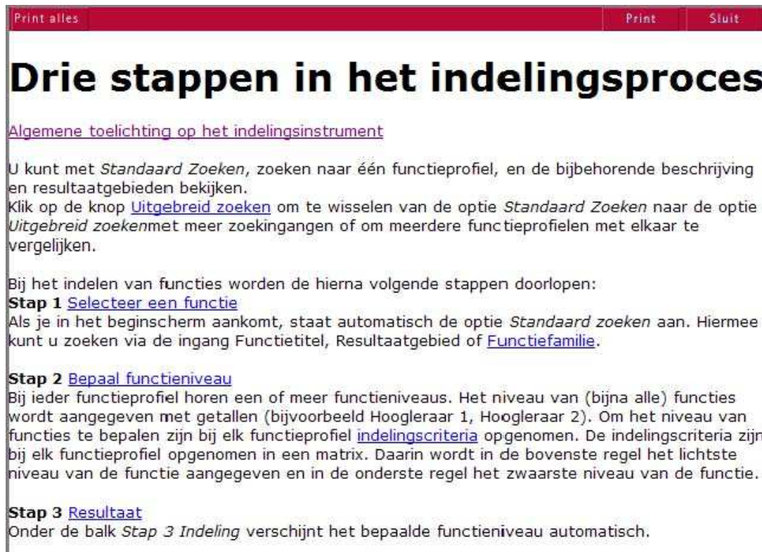
Figuur 10 Context gevoelig Helpvenster

U roept de Help op door bovenaan de pagina op de knop Help te klikken. In de Help schermen staan stap-voor-stap beschrijvingen van de mogelijkheden op die pagina. Vaak bevinden zich ook hyperlinks in de tekst die u brengen naar een ander Helponderdeel.