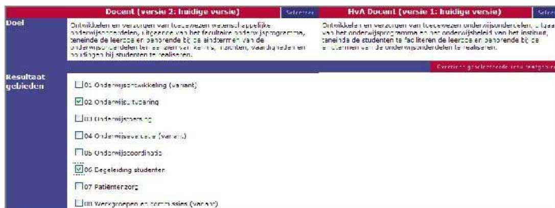
Figuur 8 Vergelijking