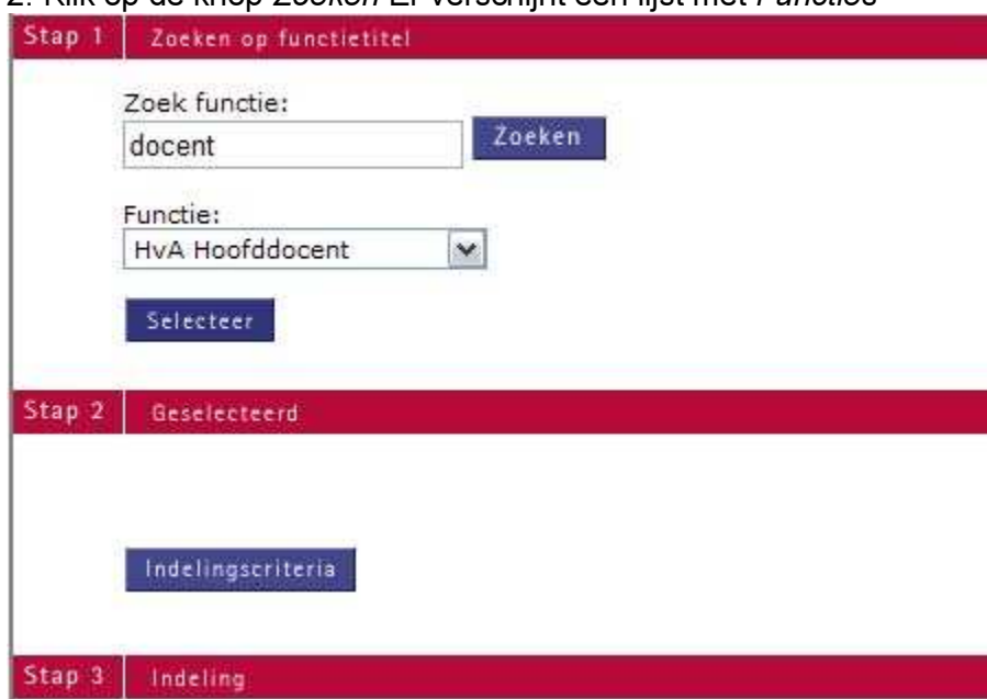
Figuur 3 standaard zoeken

2. Klik op de knop Zoeken Er verschijnt een lijst met Functies