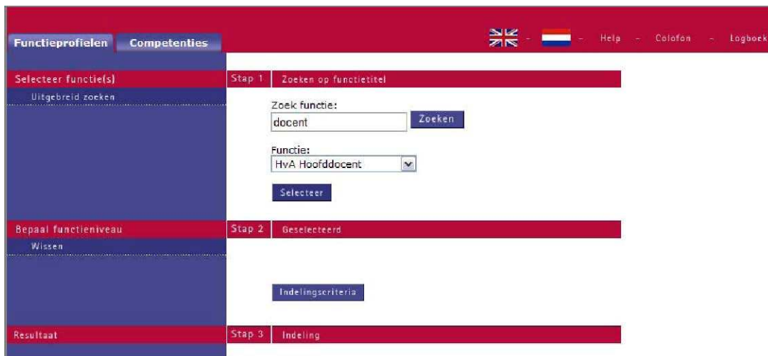
Figuur 2 Functieprofielen