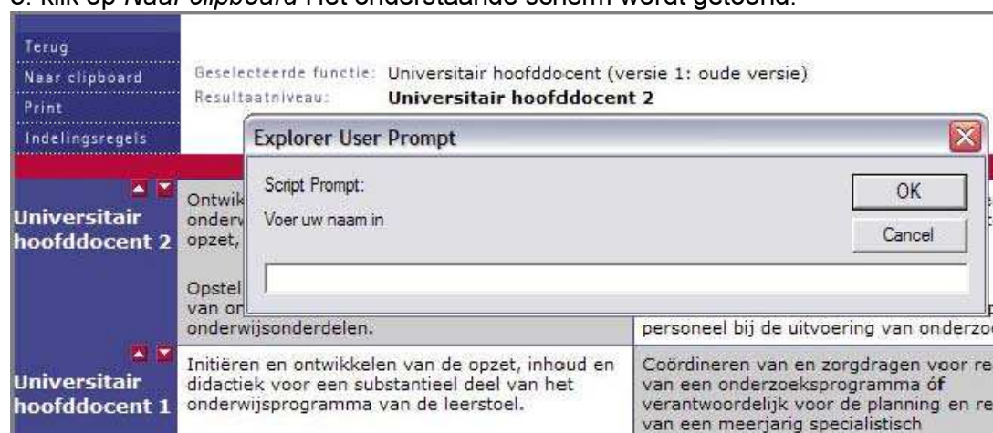
Figuur 5 gegevensuitwisseling met het klembord